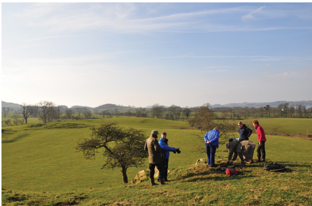
Figura 6 – Documentação de arte rupestre com equipas de voluntários em Kirkcudbright (Escócia), no decorrer do projeto Scotland's Rock Art Project.

Transformation Imaging (RTI), permitiu a captura de detalhes iconográficos, de execução, entre outros, que até aí ainda não tinham sido identificados e que foram fundamentais para os resultados obtidos. Esta tese demonstrou que a distribuição da Arte Atlântica resultou de contactos regulares e mecanismos de transmissão cultural entre regiões bastante longínquas entre si (Valdez-Tullett, 2017). O estudo cabe assim nas correntes mais atuais de investigação europeia, que incidem sobre mobilidade e o movimento de pessoas, bens, animais, culturas e ideias na pré-história. ( Figura 7 )