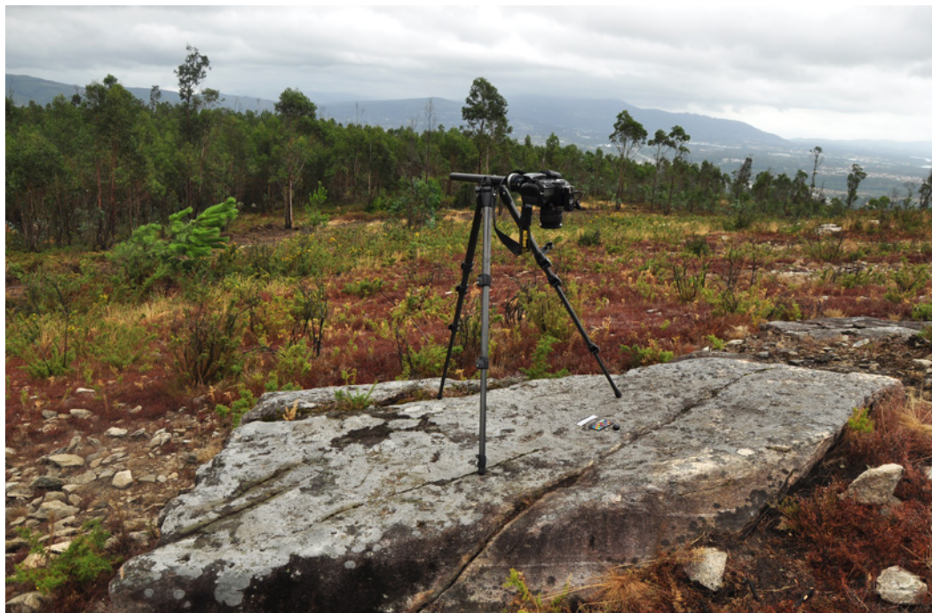
Figura 7 – Aplicação da técnica Reflectance Transformation Imaging (RTI) para registo de motivos em arte rupestre no Monte Faro.

gues, abertas a colaborações e a debates construtivos com linhas de pensamento divergentes.