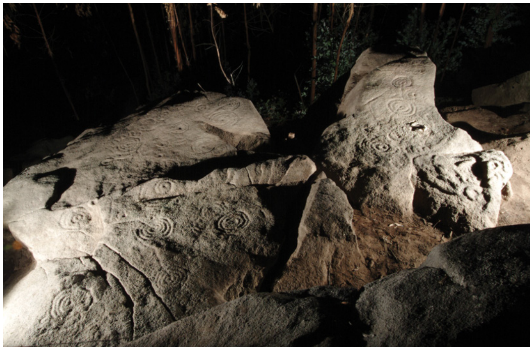
Figura 4 – O Penedo dos Sinais, nas imediações da Citânia de Briteiros (Guimarães).