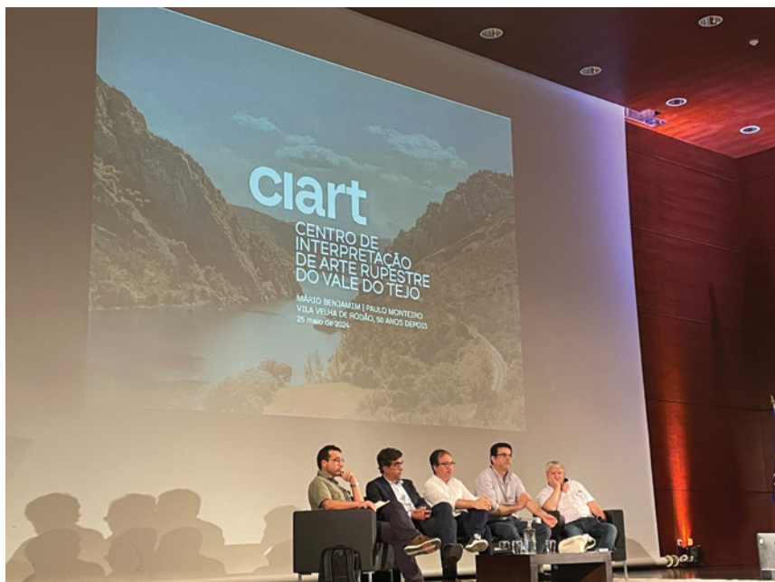
Figura 8 - Painel final durante o Seminário CIART, decorrido em Maio 2024 em Vila Velha de Rodão, ilustrando a falta de paridade que se verificou ser comum à historiografia da arte rupestre em Portugal.