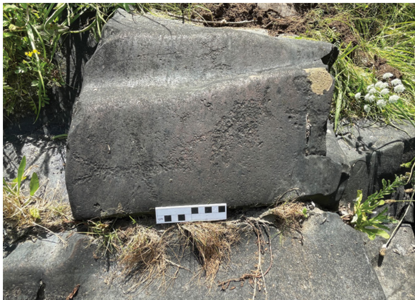
Figura 2 – Exemplo de gravura no Cachão de S. Simão no Vale do Tejo.