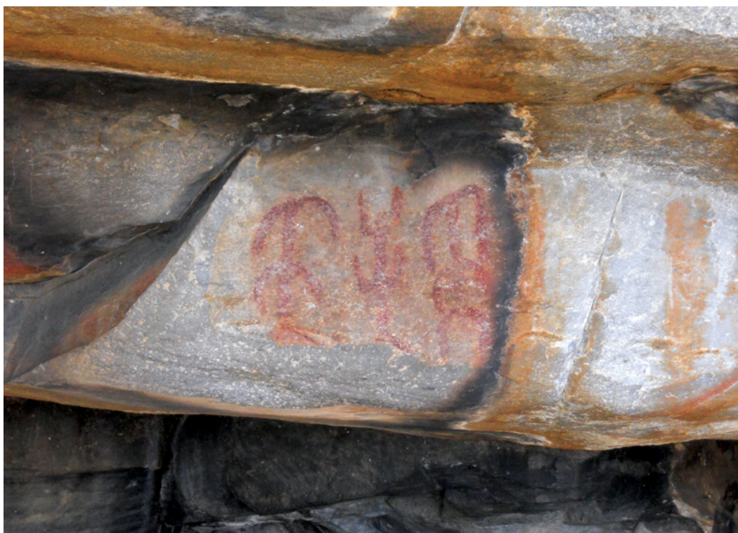
Figura 5 – Pormenor de pintura esquemática no Abrigo da Lapa dos Gaivões (Arronches).